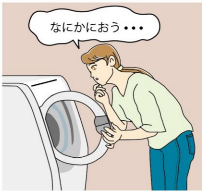
焦げ臭いにおいは、洗濯機内部の部品が摩耗している可能性があり、危険です。ただちに使用をやめてメーカーに相談することをおすすめします。

場合は「寿命が近い？」と考えてみるのも良いかもしれません。洗濯機の水漏れは箇所を特定し、洗浄してもさびや汚れが取れない場合やパッキンなどの部品が劣化していれば、部品交換が必要になります。