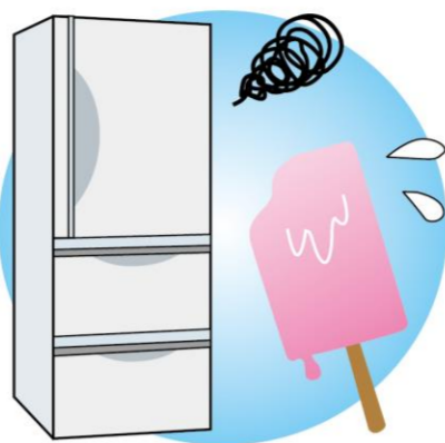
アイスなどが溶けてしまうなど症状があれば、内部の機械や部品の不具合の可能性。メーカーや電気屋さんにご相談を

冷えない、冷えが悪い場合は、食品を詰め込みすぎて冷気の出口を塞いでいないかチェックを。また、ドアパッキンの劣化の場合もあります。冷気の出口を確認し、冷気が正常に出ている