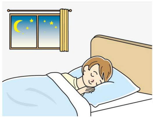
湯船に浸かると、深部体温を上げることができ、入浴後に深部体温がしっかりと下がることで、スムーズな入眠をサポートしてくれます。

冷房の効いた空間にいて、なかなか汗をかけない環境でも、湯船に浸かれば汗をかくことができ、体温調整に役立ち、熱中症のリスク回避に役立