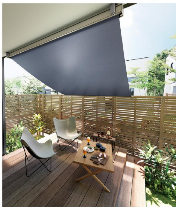
インディゴデニム