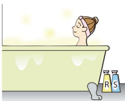
湯船の温度は、38℃～40℃がおすすめ。10～15分程度ゆっくり浸かると、体の芯まで温まることができます。

疲労回復に効果的です。 入浴時は、ちょっとした注意が必要。長時間入りすぎると、のぼせる可能性があるのと、暑いな、と思つたら、換気扇をつけたり、窓があれば開けるのもおすすめです。