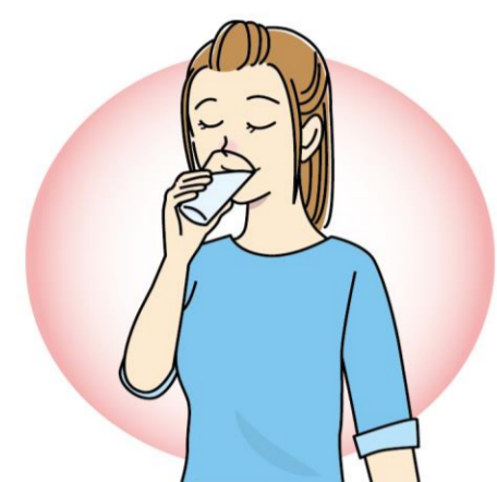
脱水を防ぐため、入浴前後には必ず水分補給をしましょう！